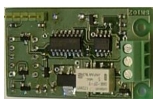
SM102 - larmkort