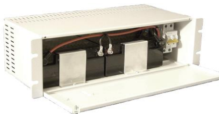
SBX193 med 2st 17Ah batterier monterade