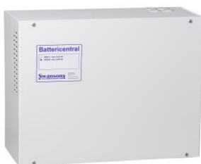
SBB45 batterihylla med säkringscentral och batteri