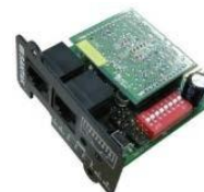
Mini Modbus Card Item No.: 10120564