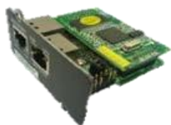
Mini NMC Card Item No.: 10120599