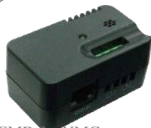
EMD for NMC Card Item No.: 10120545