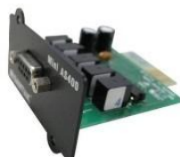
Mini AS/400 Card Item No.: 10120597