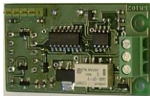
SM102 - larmkort